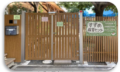
すずめ保育センター入口